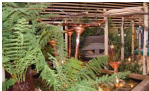
Le carré des jardiniers : des jardins à vivre, très créatifs, où le mélange et l'assemblage des matières révèlent le végétal ...